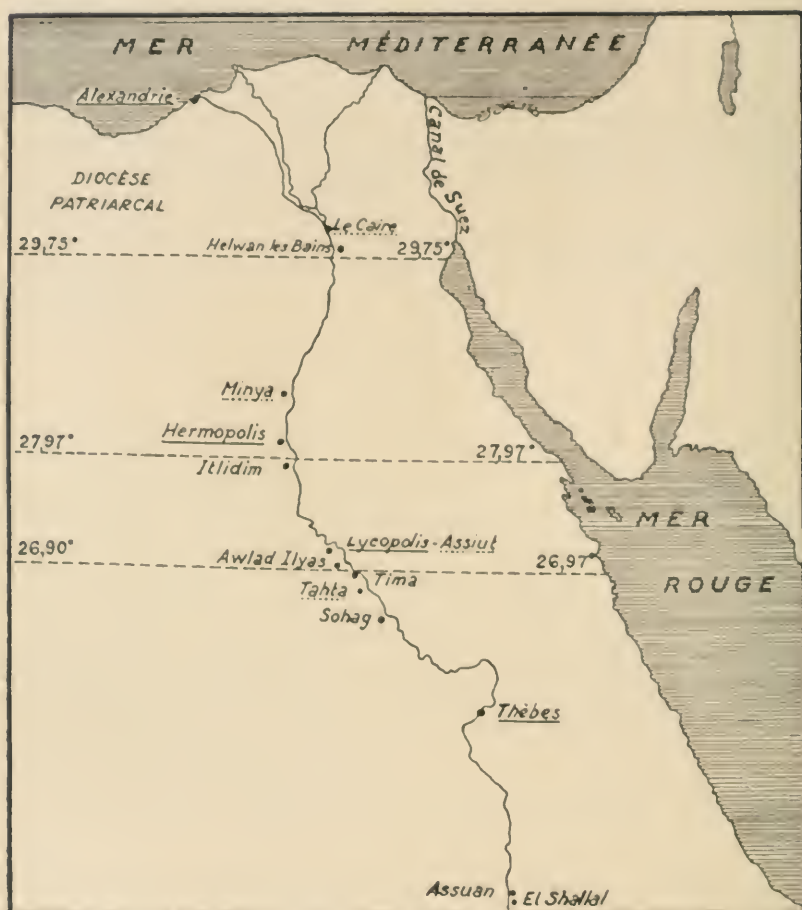
Carte 4. — Les diocèses du patriarcat copte d'Alexandrie depuis 1947.