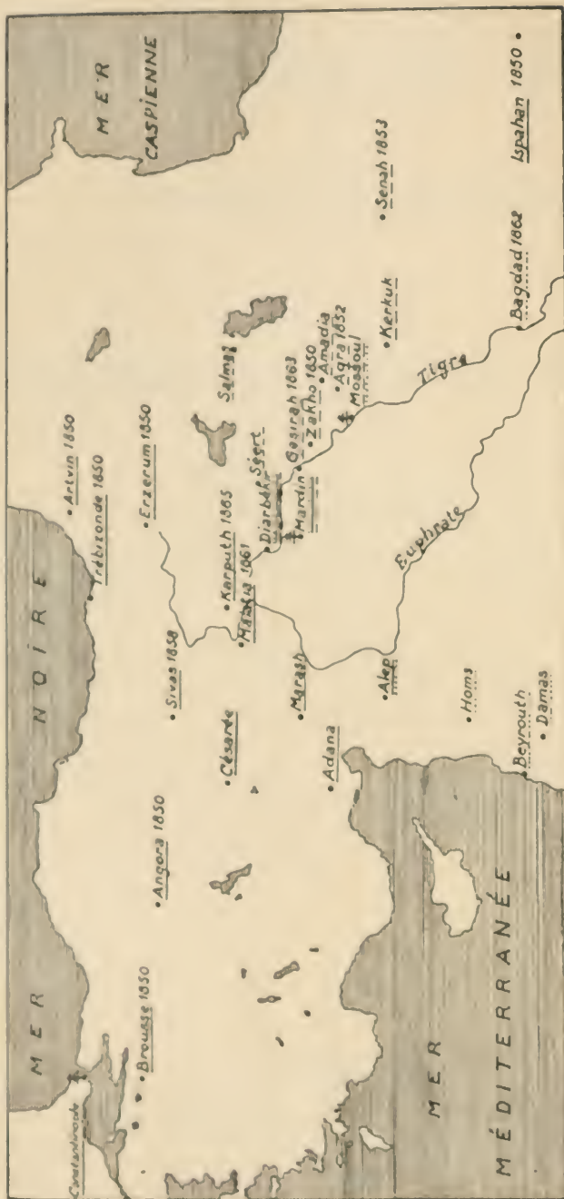
Carte 3. — Villes épiscopales des patriarchats arménien, chaldéen, syrien, en 1868.

Le \frac{1}{2} indique une résidence patriarcale; les dates sont celles des évêchés érigés entre 1850 et 1868. Ces deux indications se rapportent uniquement au premier rite indiqué sous le nom de la ville.